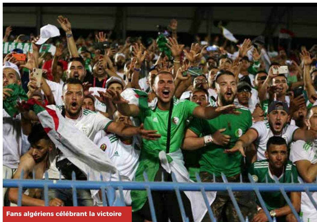
Fans algériens célébrant la victoire

C'est l'équipe à battre lors de cette Coupe d'Afrique des Nations Total 2019. Les joueurs de Djamel Belmadi ont impressionné de maîtrise depuis le début de la compétition. L'Algérie a souffert contre la Côte d'Ivoire mais entend bien remporter le titre après 29 ans de disette.