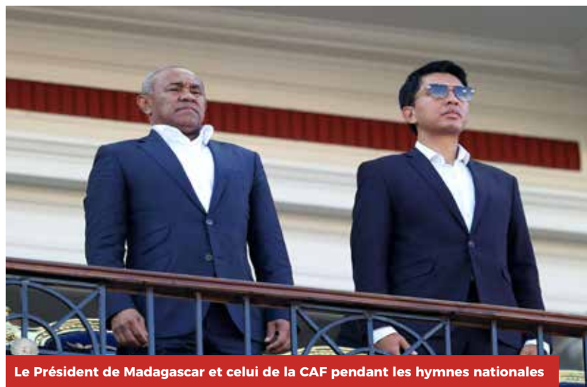
Le Président de Madagascar et celui de la CAF pendant les hymnes nationales