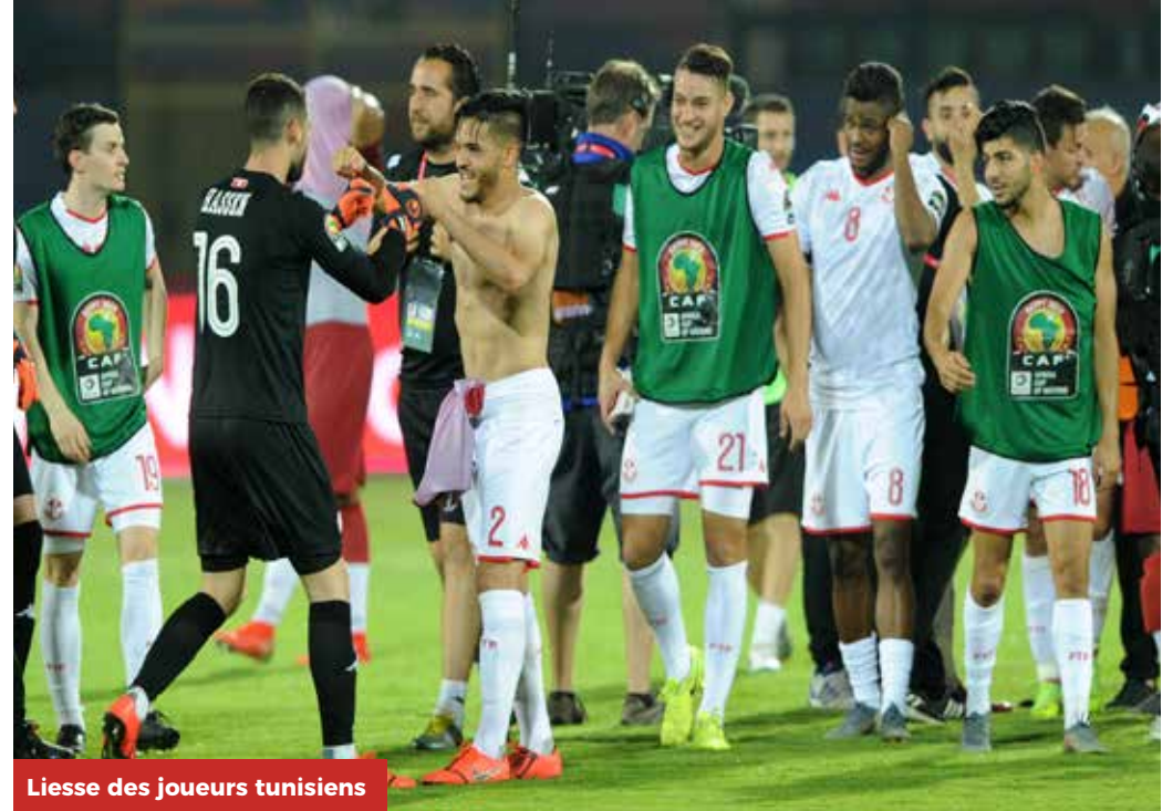
Liesse des joueurs tunisiens

Après une phase de groupes décevante, avec trois nuls en autant de matches, les Tunisiens d'Alain Giresse se sont montrés conquérants dans la phase à élimination directe. Ils joueront face au Sénégal en demi-finale de la Coupe d'Afrique des Nations Total, leur septième de l'histoire.