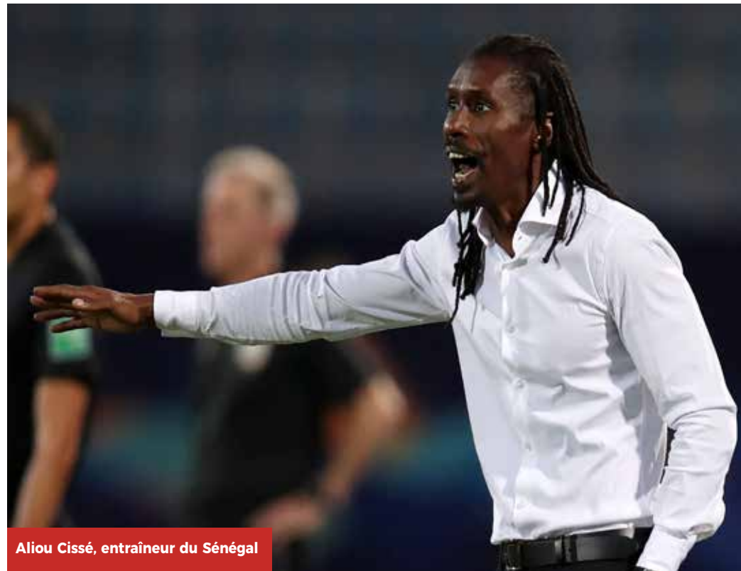
Aliou Cissé, entraîneur du Sénégal

A Dakar comme à Tunis, ce face à face de ces demi finales est très attendu. Sadio Mané et ses camarades savent qu'au pays personne ne leur pardonnerait une contre performance à ce stade de la compétition surtout après une si longue attente... Dans tout le Sénégal, l'heure est à l'optimisme. Enfin la consécration, se dit-on!