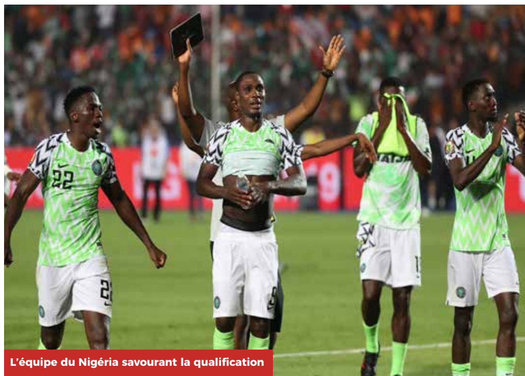
L'équipe du Nigeria savourant la qualification

Les Super Eagles sont l'une des équipes les plus expérimentées sur la scène continentale. Cette Coupe d'Afrique des Nations Total 2019 constitue leur 18ème participation à la plus grande fête du football africain. Après avoir raté les deux dernières éditions, Ighalo et ses coéquipiers veulent remporter le titre pour marquer leur retour au premier plan.