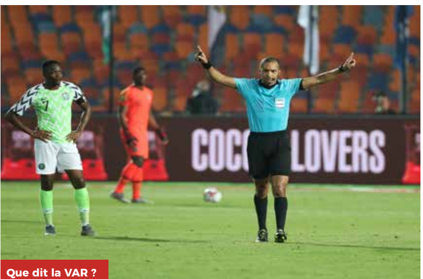
Que dit la VAR ?