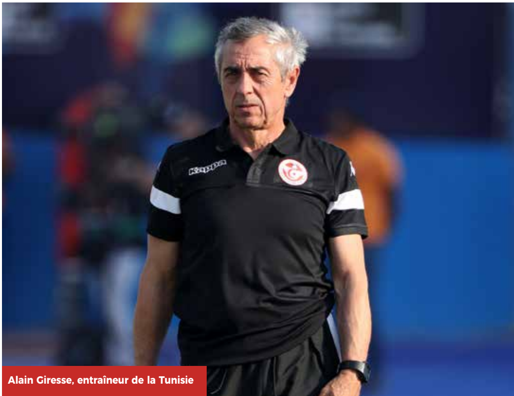
Alain Giresse, entraîneur de la Tunisie