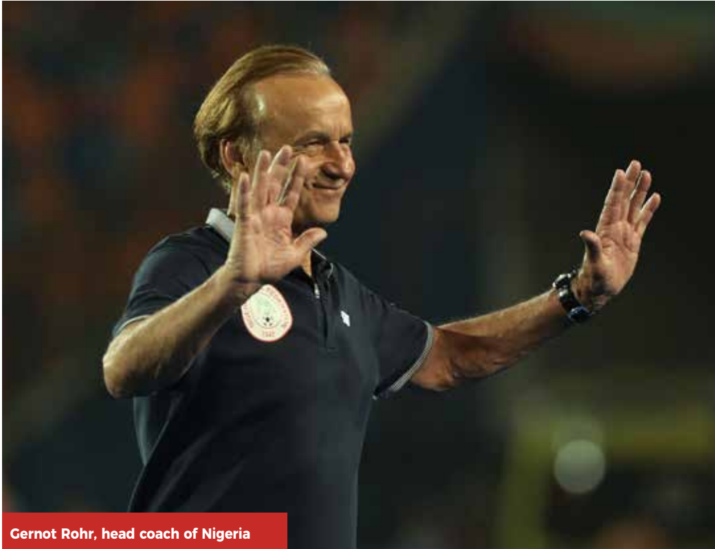
Gernot Rohr, head coach of Nigeria