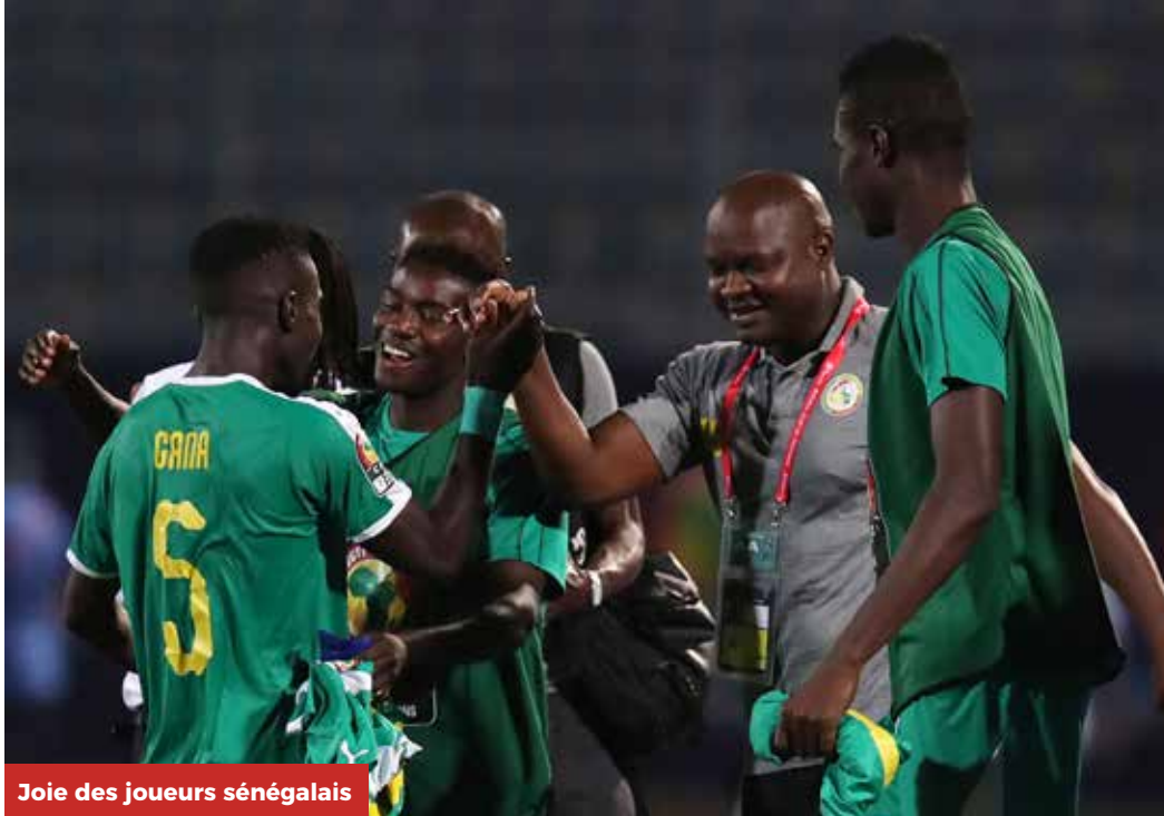
Joie des joueurs sénégalais

Le Sénégal a du talent mais peut-il remporter le tournoi ? C'est la question que se posent tous les fans des Lions, dont les joueurs de classe internationale ne sont plus à mentionner. Sadio Mané et ses coéquipiers ne pensent qu'à remporter la Coupe d'Afrique des Nations Total 2019. Tout autre résultat serait un échec pour la première nation du continent au classement FIFA.