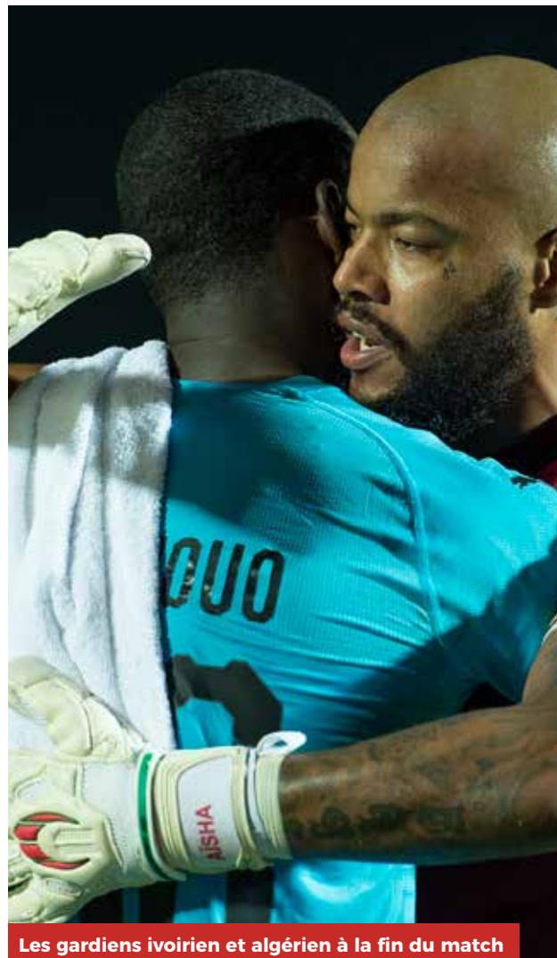
Les gardiens ivoirien et algérien à la fin du match