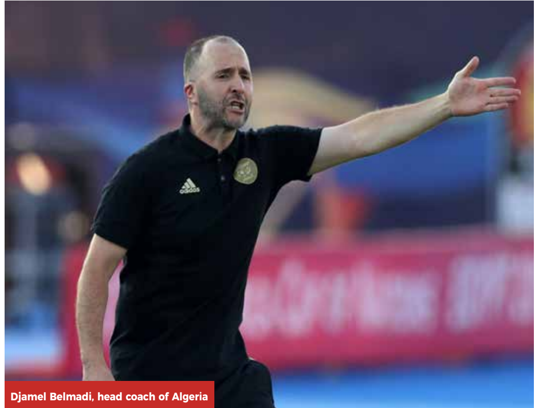
Djamel Belmadi, head coach of Algeria

Three time Africa Cup of Nations (AFCON) champions Nigeria face off with familiar rivals Algeria in yet another continental blockbuster when the two fold sleeves ready for battle in the semi finals of the Total AFCON Egypt 2019 on Sunday evening.