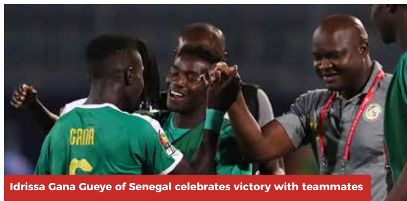
Idrissa Gana Gueye of Senegal celebrates victory with teammates

Senegal on their end also finished second in their group but with six points courtesy of victories over Tanzania and Kenya in Pool C. They started their campaign in emphatic fashion hitting the Tanzanians 2-0 before suffering their only loss of the competition, a 1-0 defeat to Algeria. They however bounced back to beat Kenya 3-0 and earn a ticket to the round of 16.