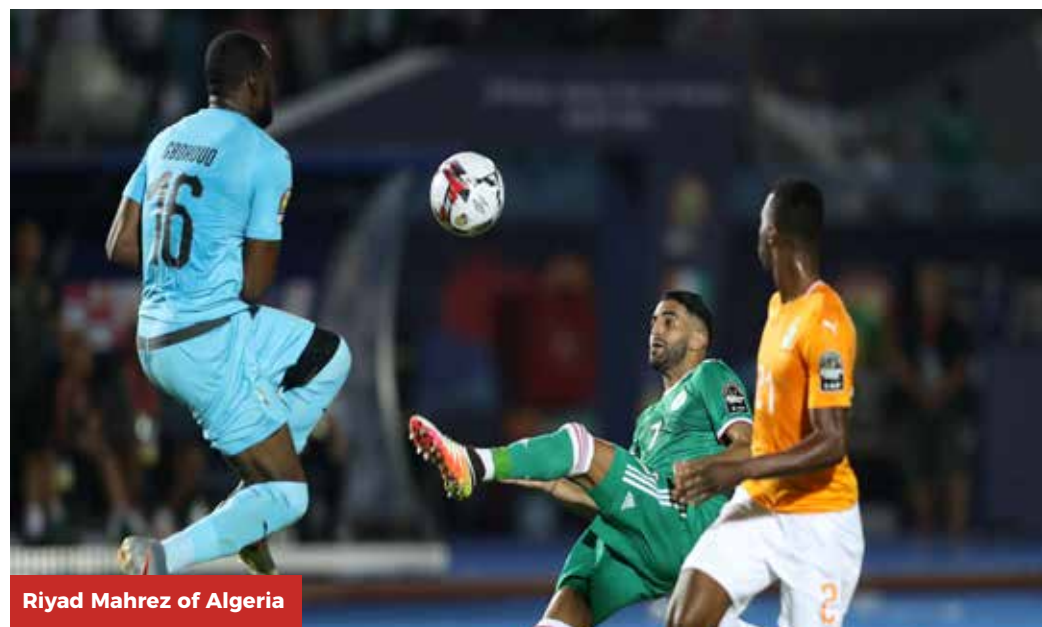
Riyad Mahrez of Algeria

Algeria's Les Fennecs were in Group C and went through the entire group phase without conceding a goal. They won 2-0 against Kenya, 3-0 against Tanzania and 1-0 against Senegal, progressing to the round of 16 unbeaten and top of the group.